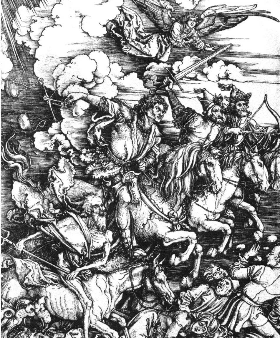
Οι Τέσσερις Ιππότες της Αποκάλυψης, του Ντύρερ

Τα κλινικά αποτελέσματα της πανώλους ήταν αποτρόπαια: μετά τη μόλυνση βουβωνικής πανώλους από τσίμπημα ψύλλου, ο ασθενής εμφάνιζε τεράστια πρηξίματα στους βουβώνες ή στις μασχάλες· εμφανίζονταν επίσης