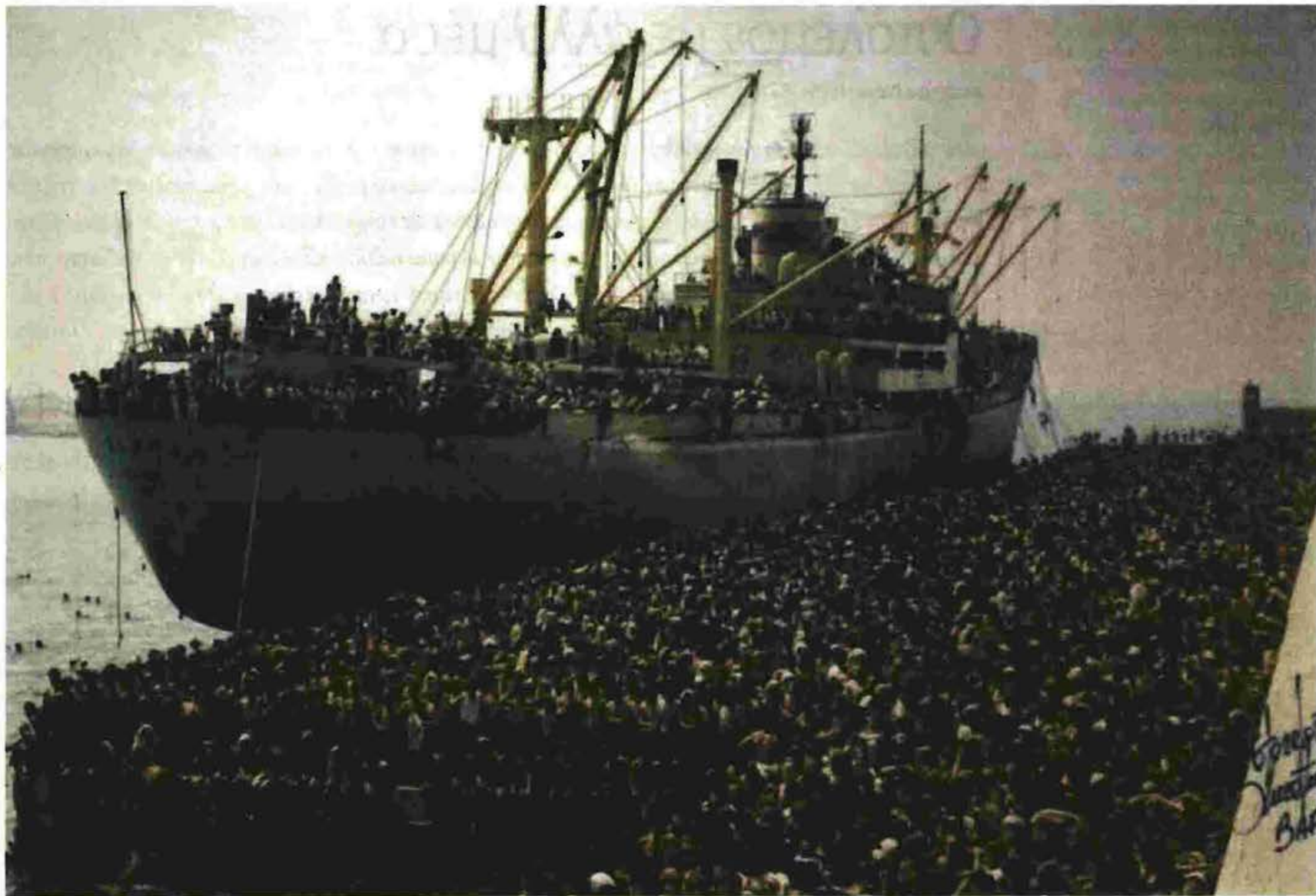
Αύγουστος 1991. Τουλάχιστον 10.000 Αλβανοί δραπέτευσαν με το πλοίο Viora στο Μπάρι. Δυστυχώς γι' αυτούς, η Ιταλία τους επέστρεψε στη χώρα τους, στην πιο δύσκολη περίοδο για την ουσιαστική επανίδρυση του αλβανικού κράτους. Η περίοδος αυτή τραυμάτισε βαθύτατα όσους έζησαν στην κόψη – και οι χώρες υποδοχής όσων δραπέτευσαν με επιτυχία δεν φρόντισαν να επουλώσουν το τραύμα.

και άτυχους, ανάμεσα σε όσους πάλεψαν για μια ταυτότητα τιμής και αξιοπρέπειας, και όσους επιλέγουν να επιζούν στα τοπία της απώλειας.