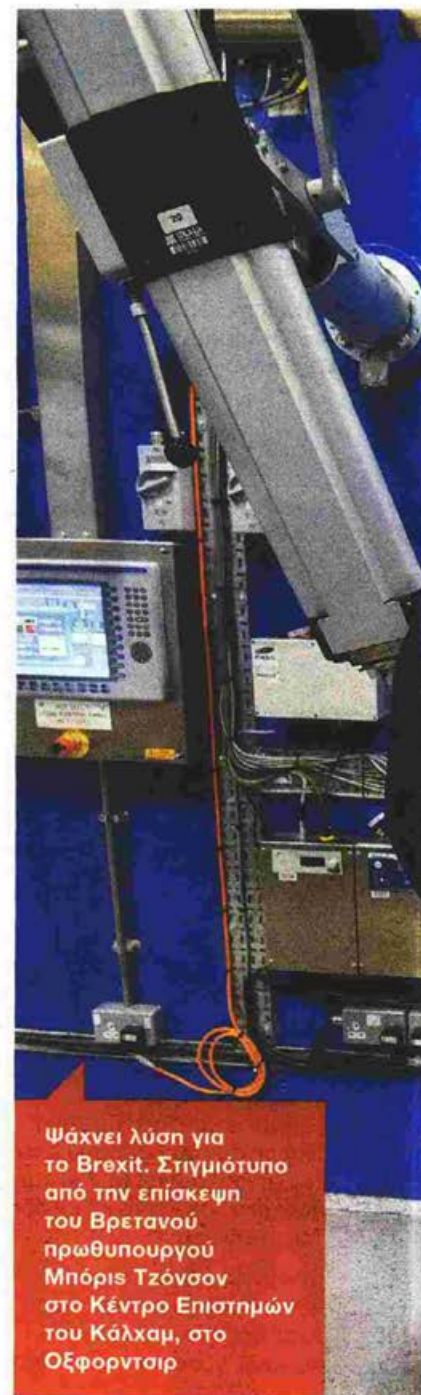
Ψάχνει λύση για το Brexit. Στιγμιότυπο από την επίσκεψη του Βρετανού πρωθυπουργού Μπόρις Τζόνσον στο Κέντρο Επιστημών του Κάλχαμ, στο Οξφωρντ

Η δεύτερη λύση για την αντιπολίτευση είναι να περάσει νόμος στη Βουλή που θα επιβάλλει τον δρόμο της παράτασης στην παρούσα κυβέρνηση. Όμως, η παράταση, με τροπολογία για παράδειγμα των Εργατικών βουλευτών, συνιστά επίσης συνταγματικό παράδοξο, αφού θα βρεθούμε στο σημείο να νομοθετεί για λογαριασμό της εκλεγμένης κυβέρνησης η αντιπολίτευση. Ως εναλλακτική λύση, οι αντίπαλοι του άτακτου Brexit εξετάζουν το ενδεχόμενο δημιουργίας κυβέρνησης εθνικής ενότητας, με αποκλειστικό αντικείμενο το αίτημα παράτασης της εξόδου, ώστε να διεξαχθούν σε σχετικά ομαλό πολιτικό κλίμα οι εκλογές. Όμως, οι Εργατικοί έχουν αποκλείσει τη συμμετοχή τους σε τέτοια κυβέρνηση, ενώ και Συντη-