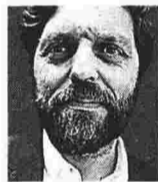
ΤΟΥ ΘΥΜΙΟΥ ΤΖΑΛΛΑ

Οι ψηφοφορίες της κοινοβουλευτικής ομάδας των Συντηρητικών για τη διαδοχή της Τερίζα Μέι κατέδειξαν την απόλυτη κυριαρχία του Brexit μέσα στο κόμμα. Κανείς από τους δέκα υποψηφίους δεν υποστήριξε την παραμονή ή το δεύτερο δημοψήφισμα. Αντιθέτως οι επίδοξοι διάδοχοι της Μέι χωρίστηκαν σε σκληροπυρηνικούς που δεν αποκλείουν το Brexit χωρίς συμφωνία και μετριοπαθείς που θέλουν ήπια έξοδο.