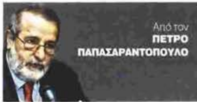
Από τον ΠΕΤΡΟ ΠΑΠΑΣΑΒΑΝΤΟΠΟΥΛΟ

Η ιδεολογία-χαμαιλέων των ΣΥΡΙΖΑΝΕΛ, η κατάληψη του κράτους, η αδυναμία των πολιτών να κατανοήσουν τα πραγματικά προβλήματα και η κρυφή δυναμική του λαϊκισμού, που μελλοντικά θα μπορούσε να βρει ξενιστή στην περιοχή της ριζοσπαστικής Ακροδεξιάς