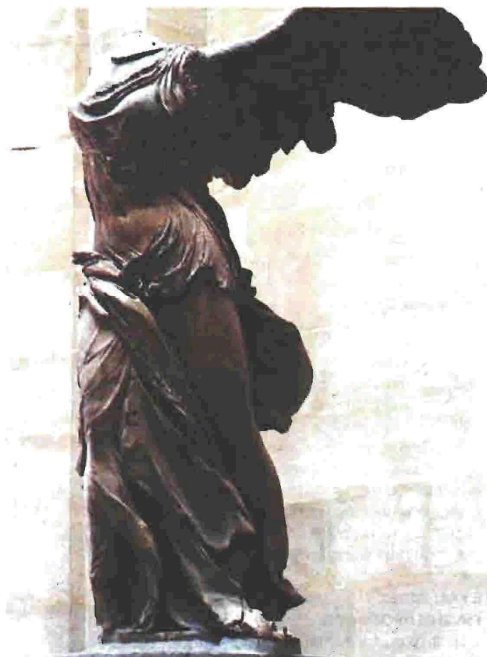
Η πιο γνωστή «Ξεντεμένη» Θρακιάτισσα: η Νίκη της Σαμοθράκης που βρίσκεται στο Μουσείο του Λούβρου, στο Παρίσι.

Τα κείμενα του τόμου προέρχονται από τις εργασίες ενός επιστημονικού συνεδρίου που διοργανώθηκε τον Σεπτέμβριο του 2006 με θέμα "Σαμοθράκη: Ιστορία - Αρχαιολογία - Πολιτισμός". Πρόκειται για έξι κοινές ερευνητικές εργασίες που η καθεμιά τους συνιστά και μια καίρια συμβολή στην ιστορία του νησιού, όπως και στην ανάδειξη της τοπικής του κληρονομιάς. Όπως σημειώνεται, "το βιβλίο αυτό αποτελεί μια μεγάλη ανασκαφή σε θέματα της τοπικής ιστορίας της Σαμοθράκης, με πρόθεση να έλθουν στο φως πολλά, από αυτά που συνήθως αλλού αναζητούνται ή δεν αναζητούνται καθόλου". Το βιβλίο καλύπτει περιόδους από την αρχαία, βυζαντινή, μεταβυζαντινή και νεότερη Σαμοθράκη, ενώ ξεκινά από τα αρχαιολογικά ευρήματα στο νησί και φτάνει μέχρι την τουριστική και γενικότερα οικονομική αξιοποίησή του, περνώντας από θέματα όπως ο λαϊκός πολιτισμός, οι λόγιοι της τουρκοκρατίας, οι κατάρες στην προφρονήσι παράδοση και πολλά ακόμη ενδιαφέροντα. Ο τόμος με τη διευρυνμένη θεματογραφία του και την επιστημονική προσέγγι-